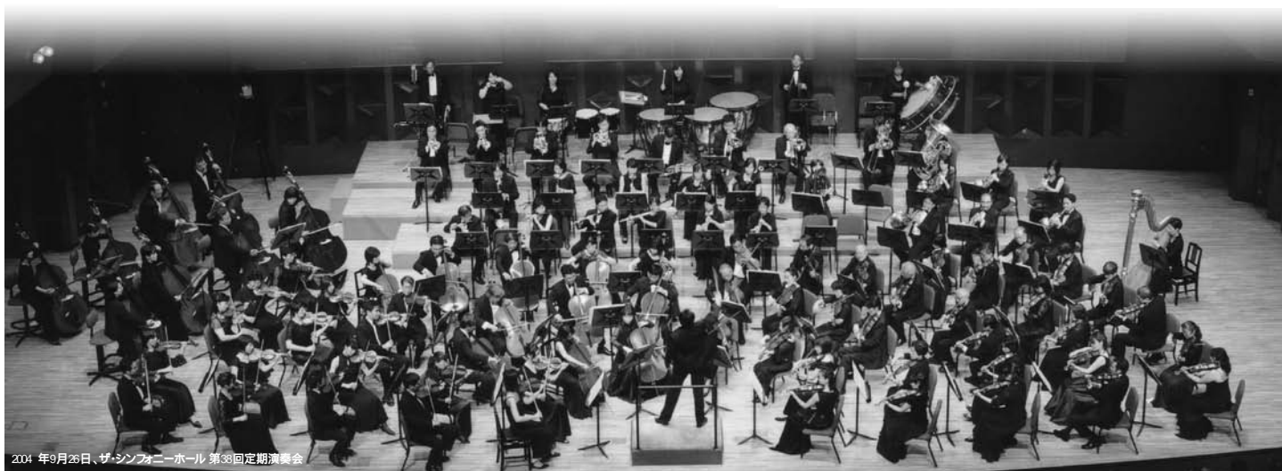
2004年9月26日、ザ・シンフォニーホール 第38回定期演奏会