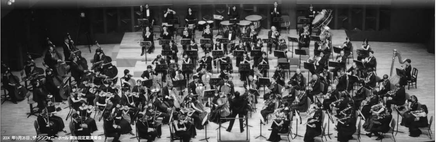
2004年9月26日、ザ・シンフォニーホール 第38回定期演奏会