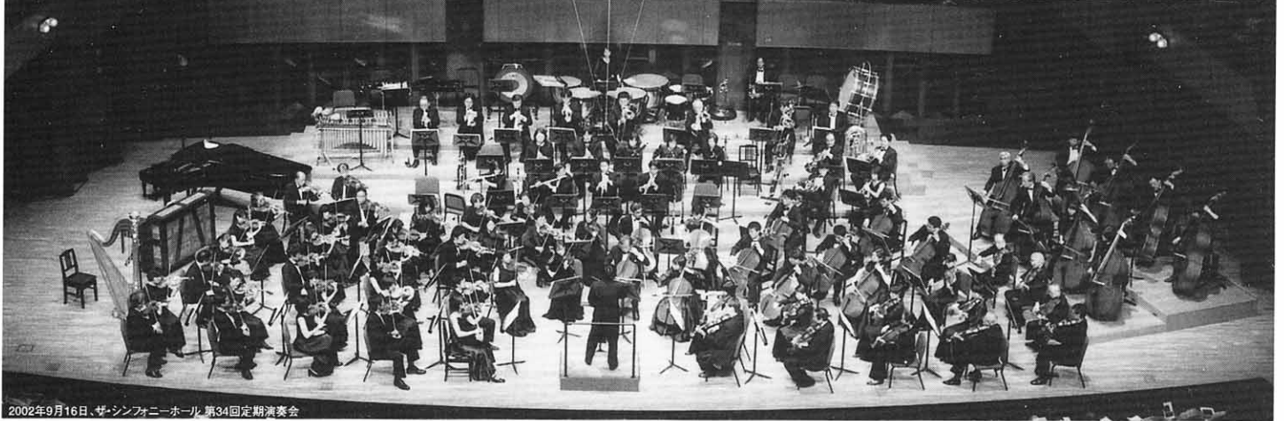
2002年9月16日、ザ・シンフォニーホール 第34回定期演奏会